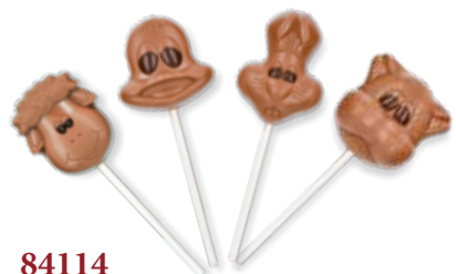
84114 Schokolutscher Bauernhoftiere, Vollmilch 4 Stück pro Verkaufseinheit