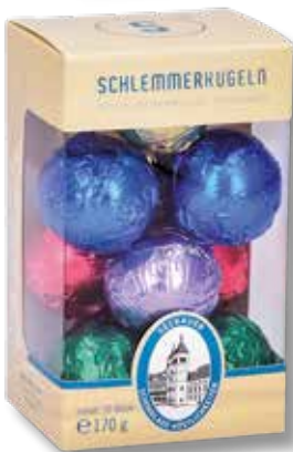
8031 S 10 Schlemmerkugeln alkoholhaltig