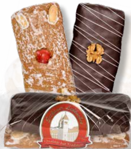
Art.Nr.: 6051 2er Lebkuchen gemischt 1 mal mit Zucker bestrichen, 1 mal mit Schokolade überzogen. Ein beliebter Lebkuchen aus unserer Backstube mit Nüssen und Frucht- stücken. L 15 x B 7,5 x H 4,5 cm 185 g