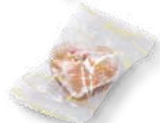
64082 Herzen ungetunkt mit Zuckerstreusel