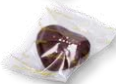
64092 Herzen in Schokolade getunkt mit Zuckerstreusel