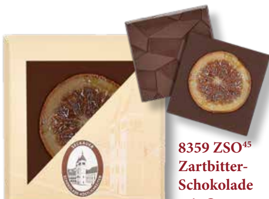
8359 ZSO 45 Zartbitter- Schokolade mit Orange