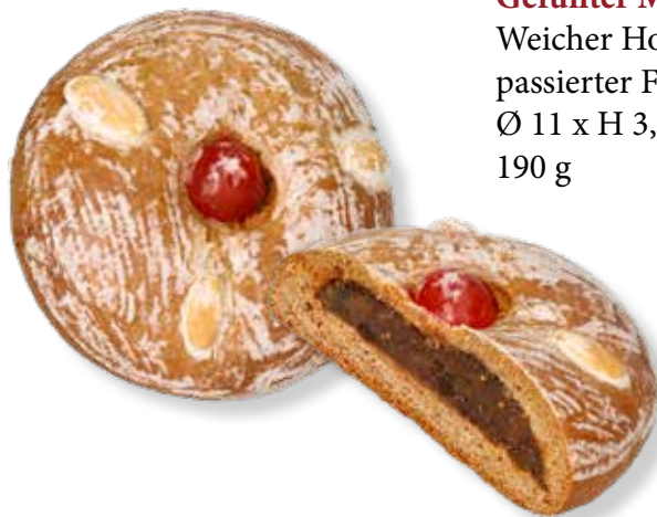
Art.Nr.: 6020 Gefüllter Murtaler Lebkuchen Weicher Honiglebkuchen mit fein passierter Fruchtfüllung. Ø 11 x H 3,5 cm 190 g