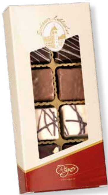
Art.Nr.: 6500 Weltmeister Lebkuchen Konfekt* L 18,2 x B 8,2 x H 3,2 cm 150 g