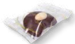
64062 Halbmonde in Schokolade getunkt mit Mandel