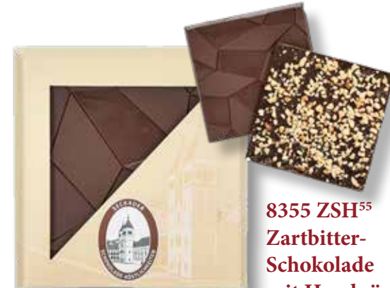
8355 ZSH 55 Zartbitter- Schokolade mit Haselnüssen