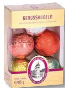
8040 G 05 Genusskugeln alkoholfrei

10er Kugeln 170 g, 10 Stück T 5,6 x B 6,4 x H 10,9 cm