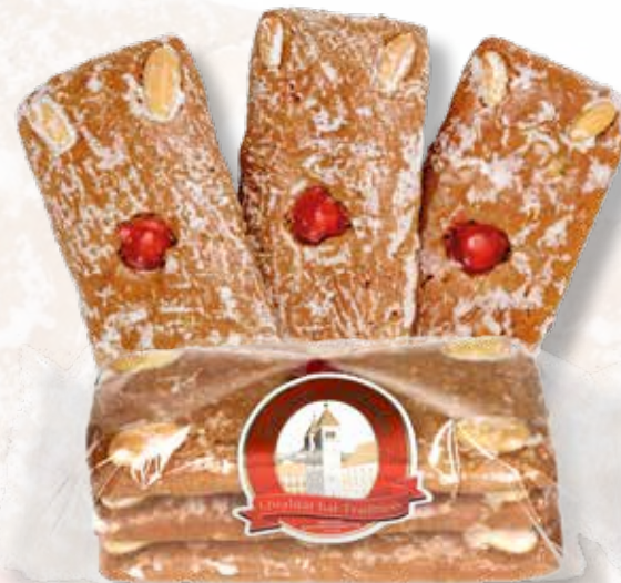
Art.Nr.: 6060 3er Lebkuchen mit Zucker bestrichen L 15 x B 7,5 x H 5,5 cm 260 g