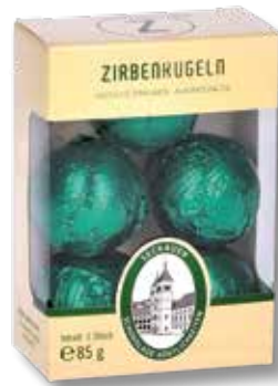
8020 Z 05 Zirbenkugeln alkoholhaltig