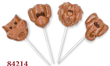
84214 Schokolutscher Zootiere, Vollmilch 4 Stück pro Verkaufseinheit