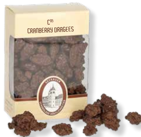
8130 C 95 Cranberry-Dragees T 3,5 x B 6,4 x H 9,2 cm 95 g

Muggerl: ab 70 Stück auch mit eigenem Etikett möglich. Bei Interesse bitte melden! Wir beraten Sie gerne!