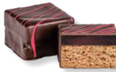
Schilcherweingelee Lebkuchen Konfekt