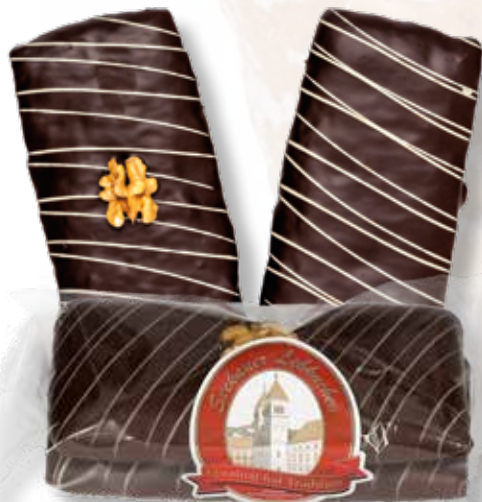
Art.Nr.: 6072 2er Lebkuchen Schokolade getunkt L 15 x B 7,5 x H 4,5 cm 200 g