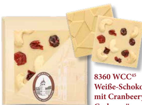
8360 WCC 45 Weiße-Schokolade mit Cranbeerys und Cashewnüssen