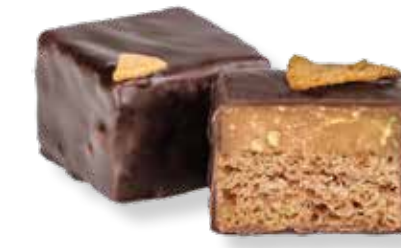
Apfel-Marzipan Lebkuchen Konfekt