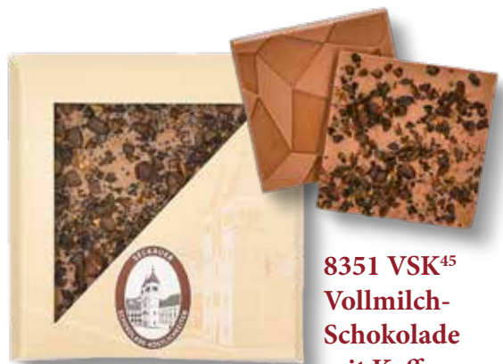
8351 VSK 45 Vollmilch- Schokolade mit Kaffee