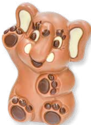
89002 SE 115 Schokoelefant L 6,5 x B 5 x H 11,5 cm 115 g