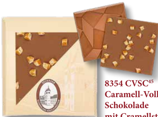
8354 CVSC 45 Caramell-Vollmilch- Schokolade mit Cramellstücken