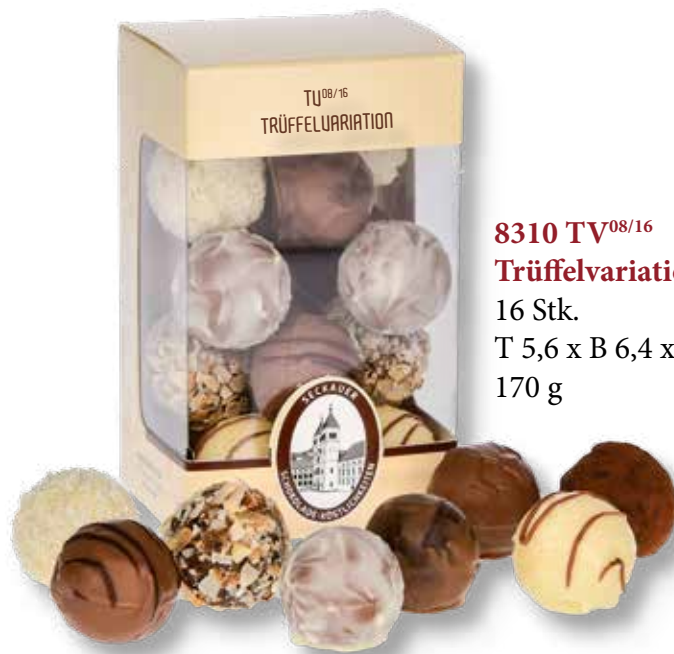
8310 TV 08/16 Trüffelvariation (alkoholhaltig) 16 Stk. T 5,6 x B 6,4 x H 10,9 cm 170 g