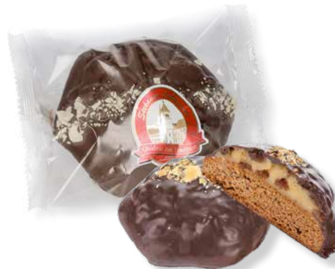
Art.Nr.: 6160 Amaretto Marzipan Lebkuchen Eine Kombination aus würzigem Lebkuchen und feinem Marzipan, mit Amaretto-Mandellikör angereicherten Rosinen, überzogen mit edler Schokolade. Ø 10 x H 3,2 cm 150 g