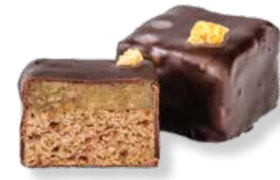
Walnuss-Marzipan Lebkuchen Konfekt