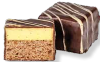
Vanille Lebkuchen Konfekt