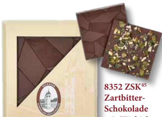
8359 ZSK 45 Zartbitter- Schokolade mit Kürbiskernen