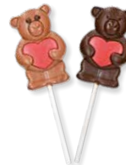
Schokolutscher Herzbär 8431 Vollmilch 8432 Zartbitter