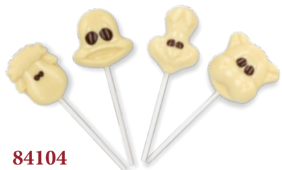
84104 Schokolutscher Bauernhoftiere, weiß 4 Stück pro Verkaufseinheit