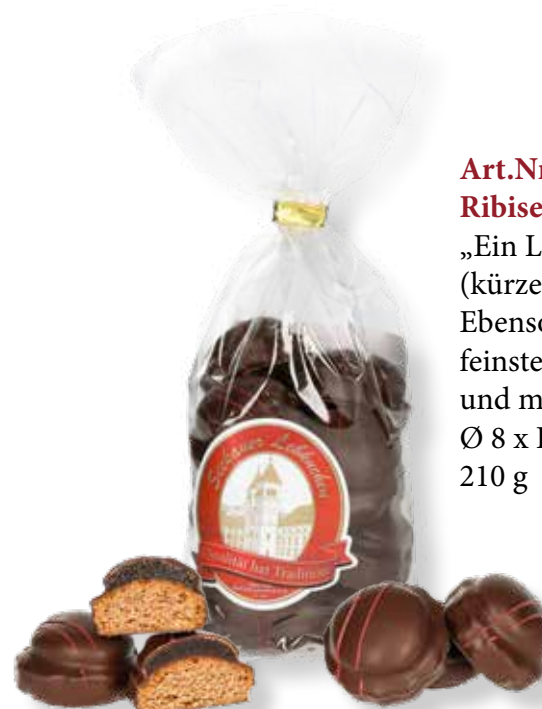
Art.Nr.: 6142 Ribisel Lebkuchenbuserl* „Ein Lebkuchenkonfekt“ (kürzere Haltbarkeit) Ebenso ein würziger Lebkuchen mit feinster fruchtiger Ribiselfüllung und mit Schokolade überzogen. Ø 8 x H 20 cm 210 g