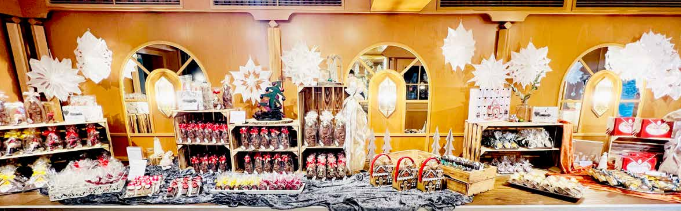
Unser alljährlicher Weihnachts- und Ostermarkt - schau vorbei!