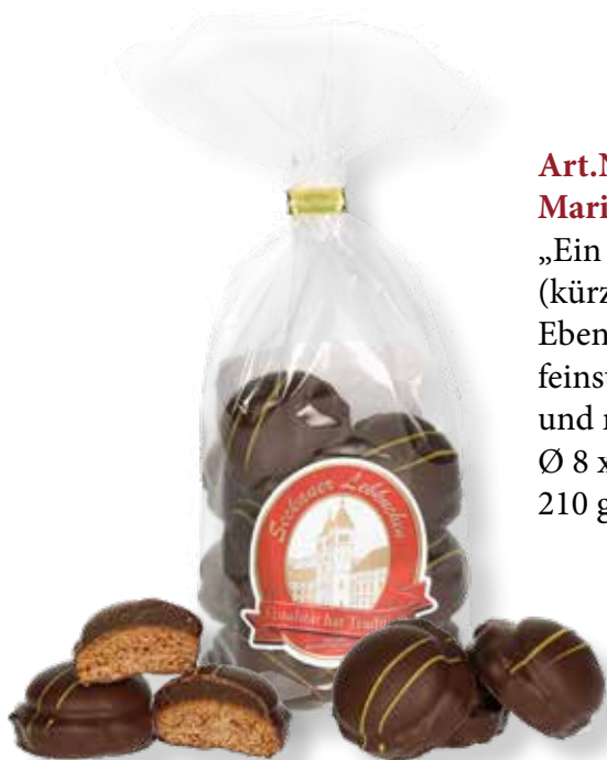
Art.Nr.: 6130 Marillen Lebkuchenbuserl* „Ein Lebkuchenkonfekt“ (kürzere Haltbarkeit) Ebenso ein würziger Lebkuchen mit feinster fruchtiger Marillenfüllung und mit Schokolade überzogen. Ø 8 x H 20 cm 210 g