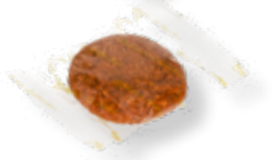
64112 Elisenlebkuchen natur

Alle Lebkuchen sind einzeln, in einer Folie mit goldenem Streudruck „Seckauer Lebkuchen“ verpackt.