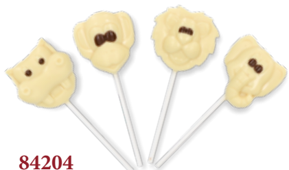
84204 Schokolutscher Zootiere, weiß 4 Stück pro Verkaufseinheit