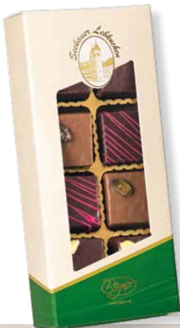
Art.Nr.: 6510 Steirisches Weltmeister Lebkuchen Konfekt* L 18,2 x B 8,2 x H 3,2 cm 150 g