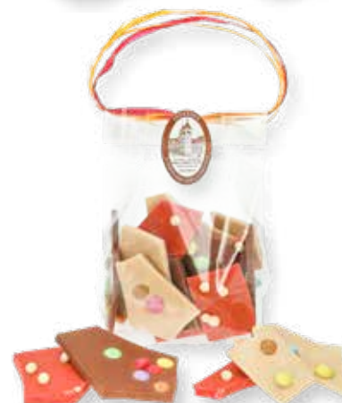
8230 SB 03/150 Schokobag Bruchschokolade für Kinder Weiße Schokolade (Zotter) mit bunten Kakaolinsen, Vollmilchschokolade (Belcolade) mit bunten Kakaolinsen, Erdbeerschokolade (Valrhona) mit Weizen crisp L 9 x B 6 x H 14 cm; 150 g