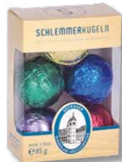
8030 S 05 Schlemmerkugeln alkoholhaltig