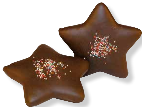
Art.Nr.: 6210 Lebkuchen Stern in Schokolade getunkt Ø 12 cm 80 g