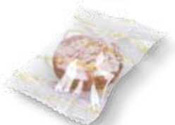
64102 Lebkuchen Busserl