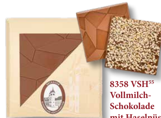
8358 VSH 55 Vollmilch- Schokolade mit Haselnüssen