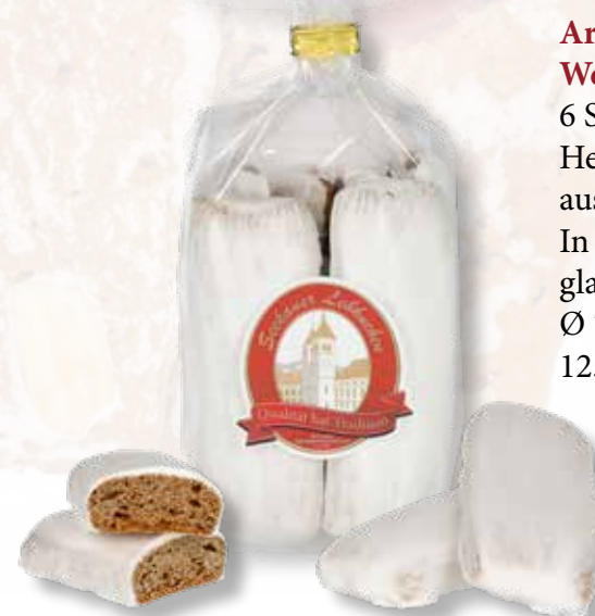
Art.Nr.: 6105 Weinbeißer 6 Stk./Sackerl Herrlicher Lebkuchen mit würzig ausgewogenem Geschmack. In Handarbeit nach alter Tradition glasiert. Ø 7 x H 20 cm 125 g