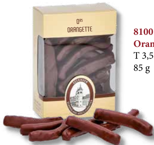
8100 O 85 Orangette T 3,5 x B 6,4 x H 9,2 cm 85 g