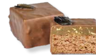
Kürbis-Nougat Lebkuchen Konfekt