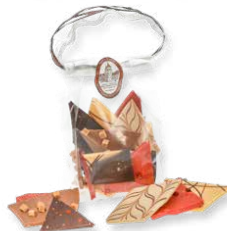
8231 SB 05/150 Schokobag Bruchschokolade Weiße Schokolade (Zotter), Caramell-Vollmilchschokolade (Belcolade) mit Caramellstücken, Zartbitterschokolade (Belcolade) mit Chili, Erdbeerschokolade (Valrhona) mit rosa Pfeffer, Passionsfruchtschokolade (Valrhona) L 9 x B 6 x H 14 cm; 150 g