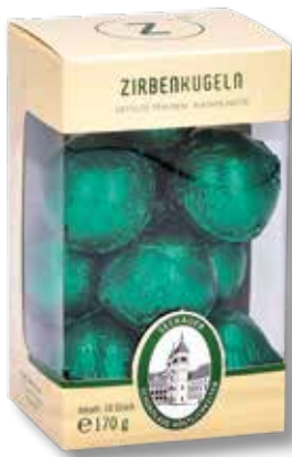
8021 Z 10 Zirbenkugeln alkoholhaltig