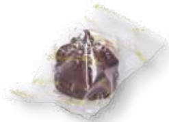
64012 Zirbentrüffel Busserl