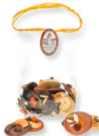
8240 B 110 Betthupferl-Rohkosttaler Weiße Schokolade (Zotter), Vollmilchschokolade (Belcolade), Zartbitterschokolade (Belcolade) mit Nüssen und Trockenfrüchten L 9 x B 6 x H 14 cm; 110 g