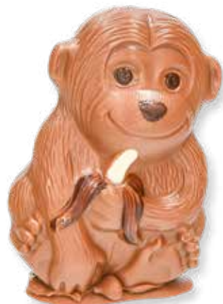
89001 SA 115 Schokoaffe L 8 x B 5 x H 11,5 cm 115 g