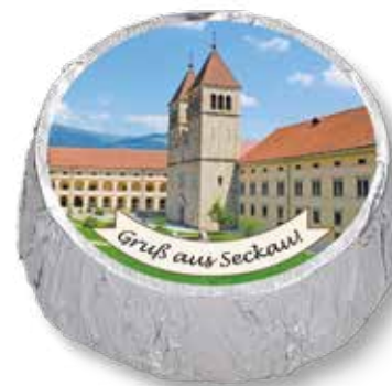
8380 „Gruß aus Seckau“-Muggerl Silber – Knuspernougat in Zartbitter Ø 5 cm, H 1,5 cm 35 g

Muggerl: ab 70 Stück auch mit eigenem Etikett möglich. Bei Interesse bitte melden! Wir beraten Sie gerne!