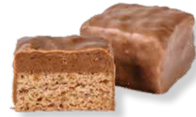
Knusper-Nougat Lebkuchen Konfekt