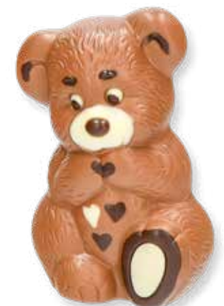
89003 SB 120 Schokobär L 8 x B 5 x H 11,5 cm 120 g