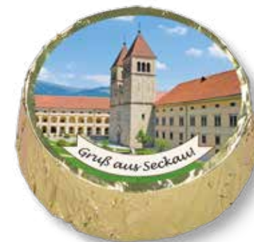
8381 „Gruß aus Seckau“-Muggerl Gold – Mandel-Nougat in Vollmilch Ø 5 cm, H 1,5 cm 35 g