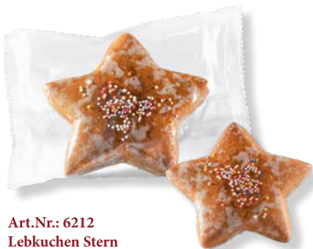
Art.Nr.: 6212 Lebkuchen Stern mit Zucker bestrichen Ø 12 cm 75 g