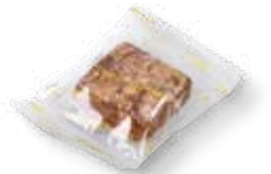
64042 Basler Leckerli