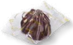
64022 Zirbentrüffel-Kürbiskern Busserl