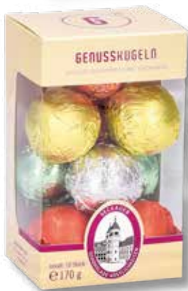
8041 G 10 Genusskugeln alkoholfrei