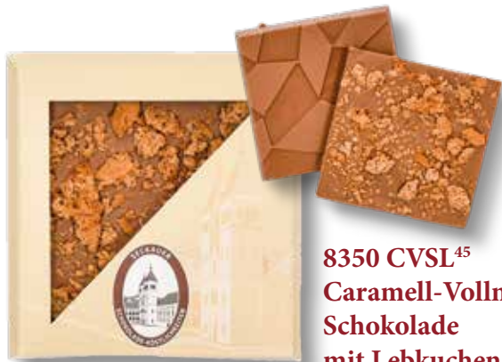
8350 CVSL 45 Caramell-Vollmilch- Schokolade mit Lebkuchencrunch