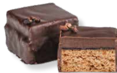
Zirben-Preiselbeer Lebkuchen Konfekt