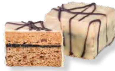
Pflaume-Weinbrand Lebkuchen Konfekt